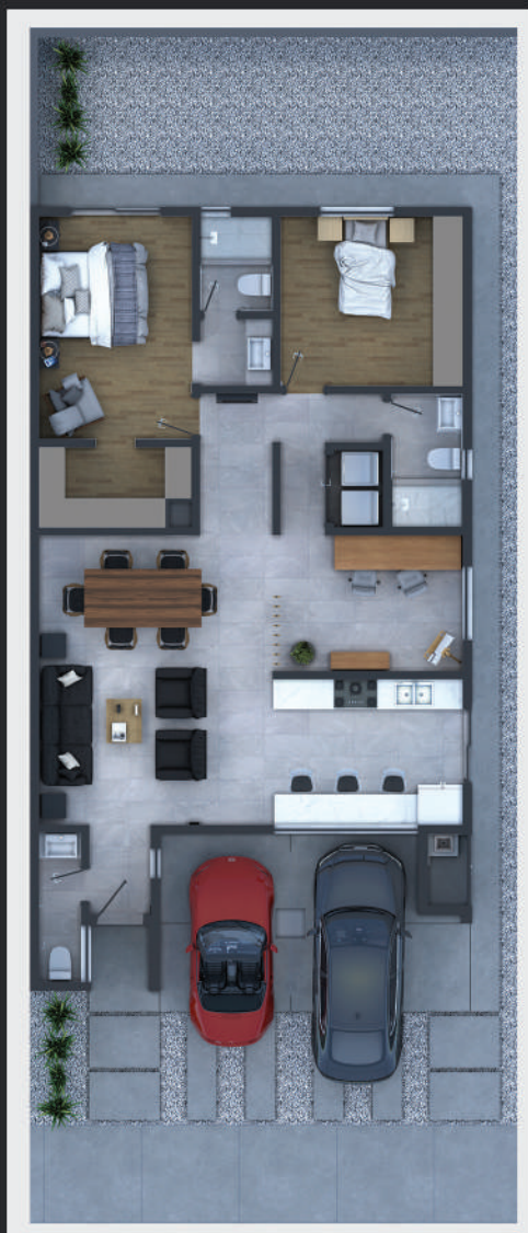
OPCIÓN A ESTANCIA