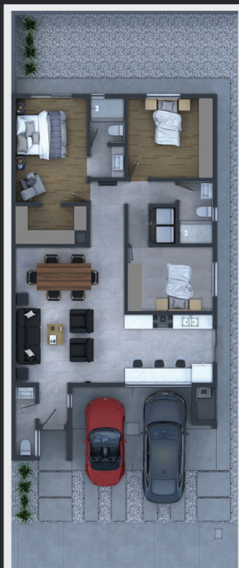
OPCIÓN B 3 RECÁMARAS